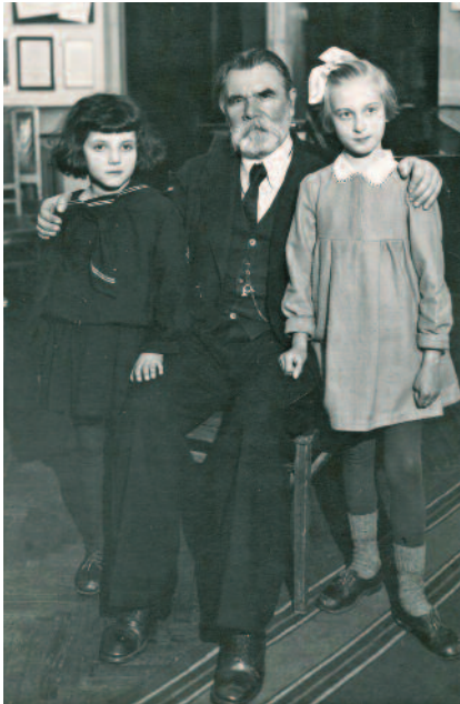
Gedicke met twee jonge leerlingen in 1947.

De korte, overzichtelijke en melodisch aantrekkelijke pianostukken van Aleksandr Gedicke zijn van bijzondere waarde bij de introductie van diverse spelmanieren en het opbouwen van speltechniek. Niet alle werken zijn buiten Rusland bekend, maar ook in zijn vaderland wordt het merendeel van Gedicke's