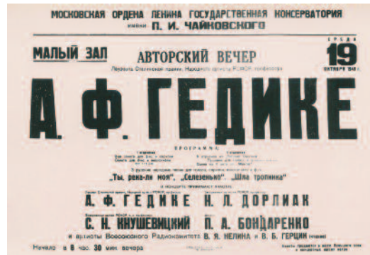
Affiche van een concert op 19 oktober 1949 in de Kleine Zaal van het Tsjaikovski Conservatorium in Moskou.