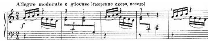
1. Etude, opus 32 nr. 11.2