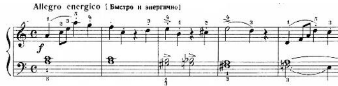
2. Etude, opus 6 nr. 2.

derde, vierde en vijfde vinger van de linkerhand, etudes met parallele bewegingen of symmetrische beweging van handen met egale activatie van alle vijf vingers van elke hand.