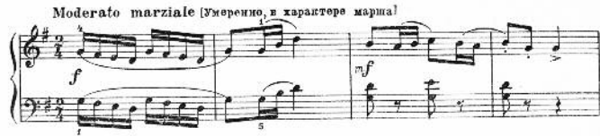
3. Etude, opus 36 nr. 5.

derde, vierde en vijfde vinger van de linkerhand, etudes met parallele bewegingen of symmetrische beweging van handen met egale activatie van alle vijf vingers van elke hand.