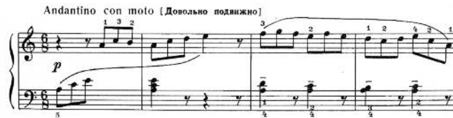
4. Etude, opus 36 nr. 13.

In alle stukjes houdt de componist rekening met de mogelijkheden van kleine kinderhanden en de beperkte fysieke kracht van jonge spelers. Zeer spaarzaam schrijft hij forte en fortissimo voor, net zo min als sterke crescendo's, dit om de kinderhanden niet te zwaar te belasten. Zijn aandacht gaat naar de melodische lijnen in een compositie. De pianowerkjes voor beginners zijn overwegend eenstemmig, pas later voegt Gedicke de harmonische ondersteuning die in het begin alleen bij herhalingen geïntroduceerd wordt. Een aantal stukken is volledig opgebouwd rondom een melodie binnen in één octaaf. Hij gebruikt geen grote intervallen om de melodische structuur duidelijk te maken. Er zijn melodieën die zich beperken tot een terts, kwart of kwint met de daaropvolgende opvulling van dit interval. De melodieën die zich binnen een octaaf afspelen, worden verdeeld in kwart- en kwintgroepjes om de melodische grenzen te markeren.