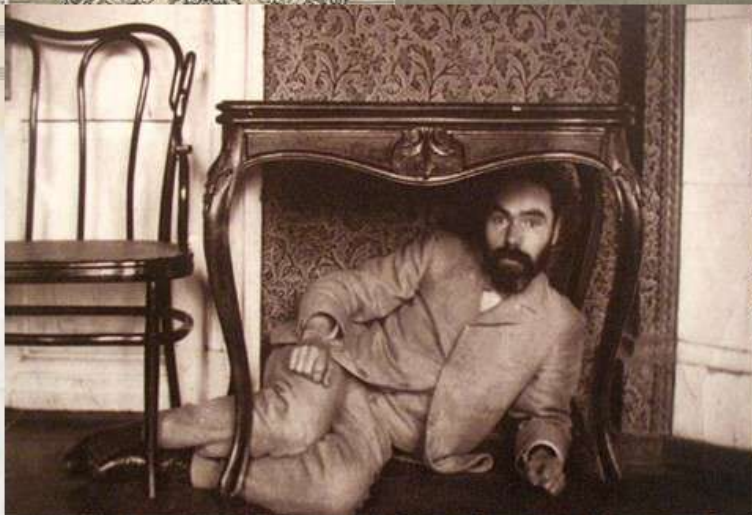
Фото начала XX века